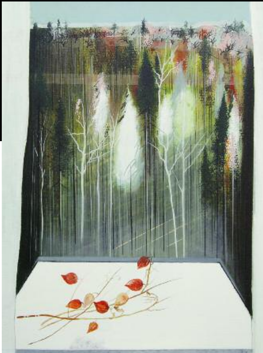
Jeseň II. olej, 80x100 cm, 2008

Narodila sa 2. marca 1950 v Bratislave. V roku 1976 ukončila Vysokú školu výtvarných umení v Bratislave.