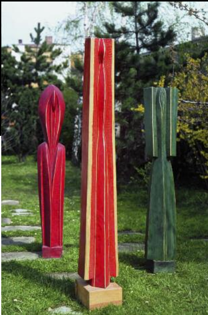
Kompozícia plastík, drevo, 1965 - 67

Narodil sa 17. januára 1928 v poľskej Čiernej Hore, zomrel v roku 1992. Študoval na pražskej Vysoké škole umelecko-priemyselnej, ktorú ukončil v roku 1951.