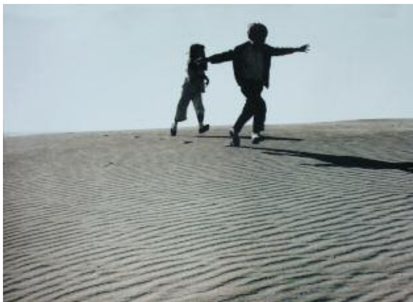
Vek nevinnosti I., fotografia