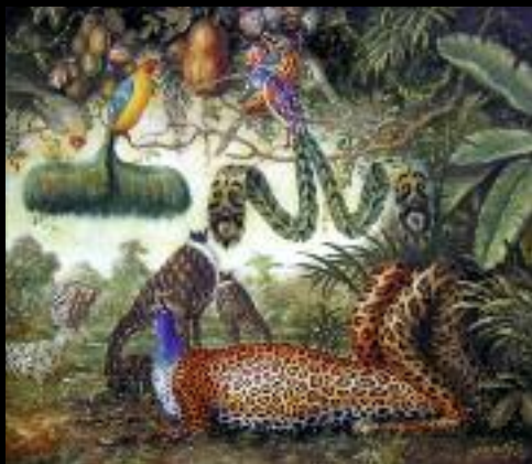
Obráz č. 9, 70x90 cm, 2006