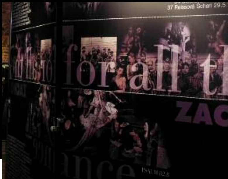
"INTOLERANCIA (inšpirované Hieronymom Boschom)"