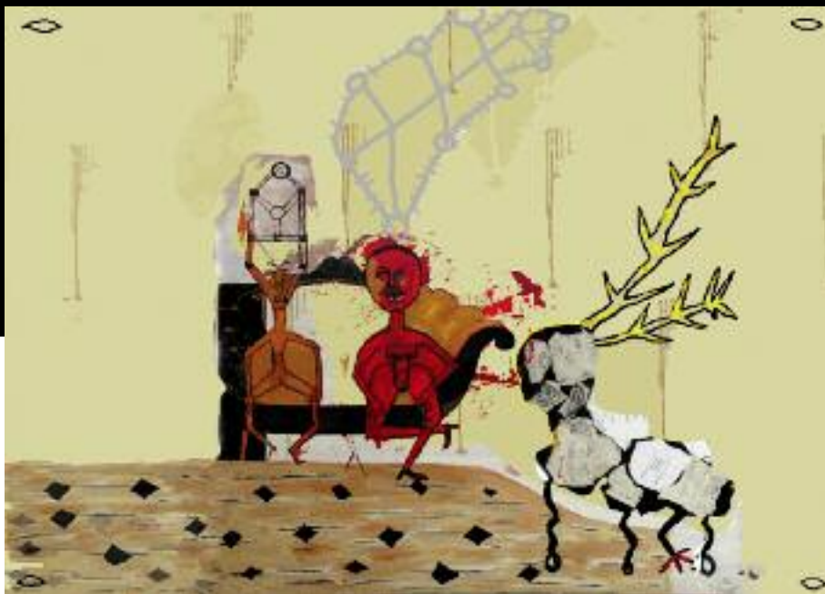
Mr&Mrs Récamié, 190 x 200 cm - akryl, olej, plátno, 2009

Narodil sa 10. mája 1956 v Bratislave. Vysokú školu výtvarných umení v Bratislave absolvoval v roku 1981.