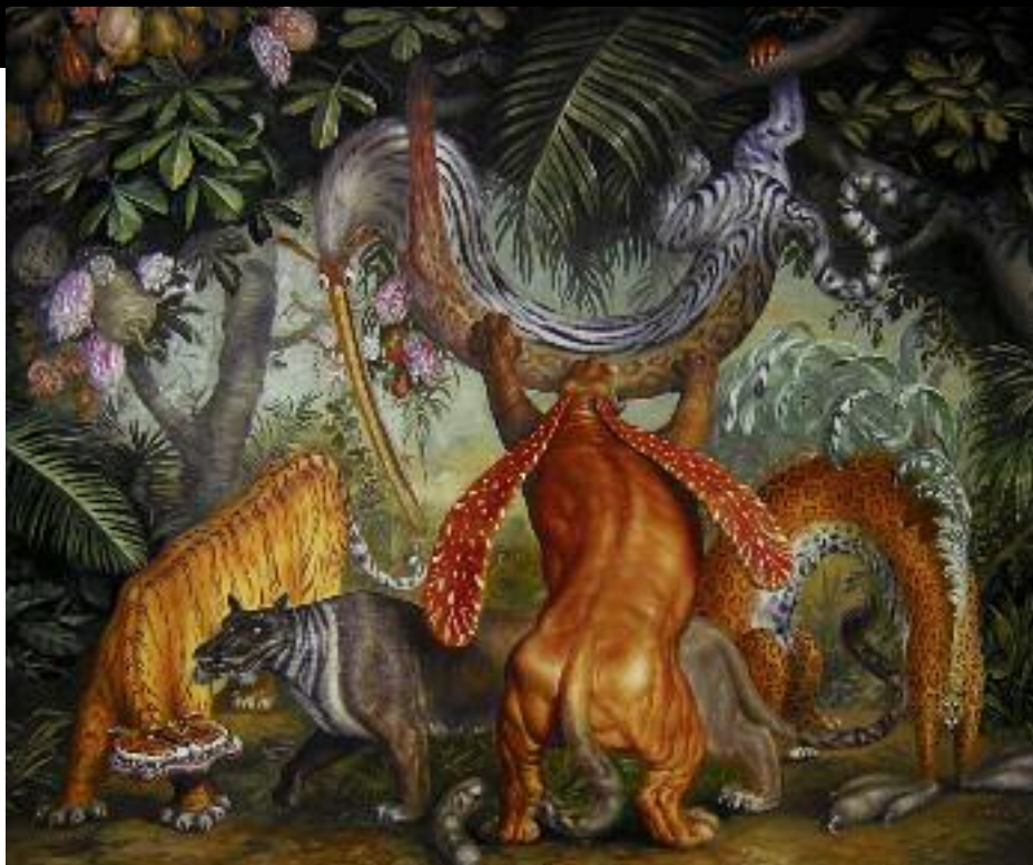
Obráz č. 7, olej, 100x120 cm, 2005

Narodil sa 16. marca 1953 v Bratislave. Vysokú školu výtvarných umení v Bratislave absolvoval v roku 1980.