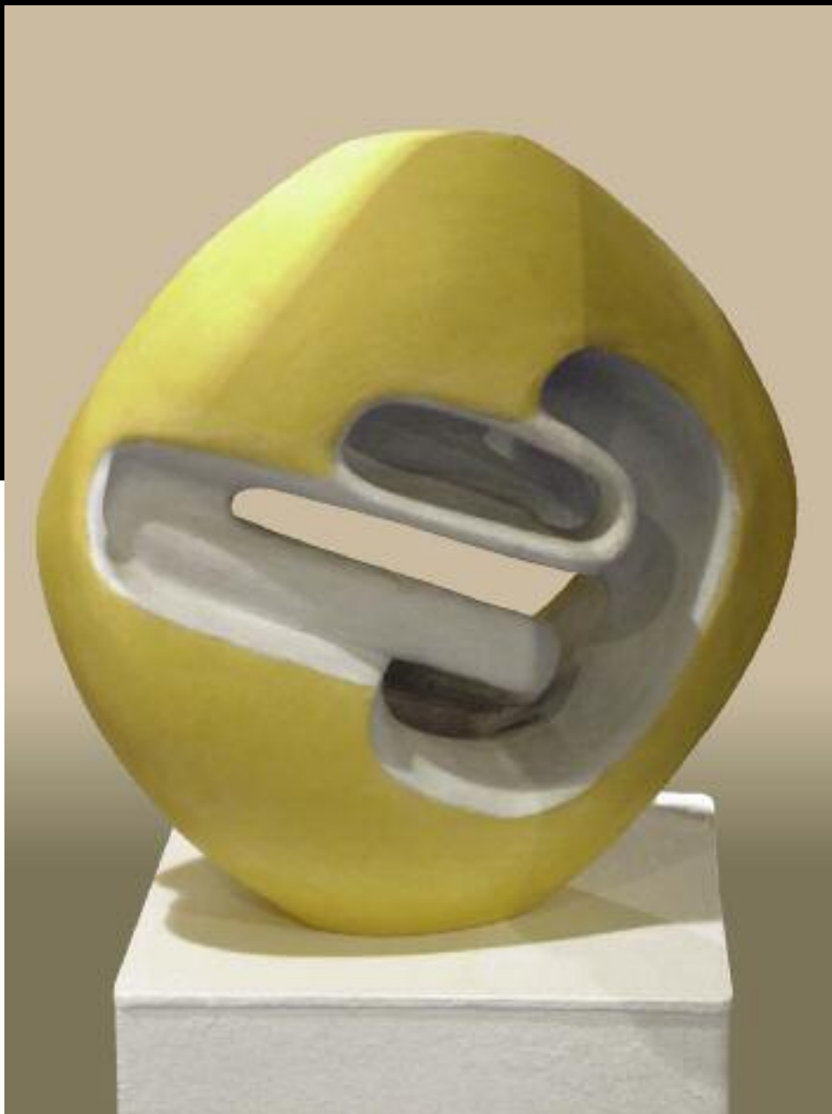
Univerzum 11, epoxyd, v 33 cm, 2000

Narodil sa 23. februára 1930 vo Visolajoch. Vysokú školu výtvarných umení v Bratislave absolvoval v roku 1954.