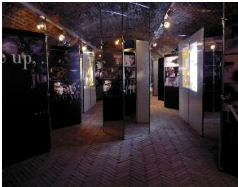
inštalácia v budove SNM na Žiškovej 12, Bratislava december 2009 - január 2010

Narodil sa 1. decembra 1939 v Bratislave. Absolvoval bratislavskú Školu umeleckého priemyslu (1958).