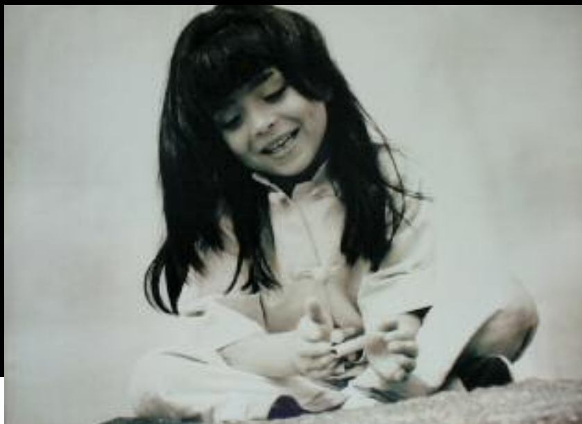
Vek nevinnosti V., fotografia

Tu sa spoznala s režisérom s výrazným výtvarným talentom držiteľom Oscara, Dušanom Vukotičom, tu sa začala jej kreatívna cesta umeleckej fotografky. Už v roku 1967 otvorila na bratislavskej Malej scéne prelomovú výstavu. Po prvýkrát vystavila obrazové cykly. Cykly plné inotajov. Najúspešnejšiu výstavu tých čias predžili o niekoľko mesiacov. Nasledne ju Jindřich Chalupecký pozval do Prahy na výstavu „13 zo Slovenska“. Svoj talent uplatnila i v monumentálnej tvorbe a v televíznom scénickom výtvarníctve. Jej jedinečný, charakteristický rukopis poznať v cykle štylizovaných hereckých portrétov. Stromy sú alegóriou kolobehu života. Venuje sa fotografickej ilustrácii kníh poézie a prózy. Začiatkom deväťdesiatych rokov pracovala na projekte Spomienky na detstvo. Kultivovane, s veľkým citom pre myšlienku a príbeh sa tu vyrovnáva s minulosťou, zázračným svetom detstva, rokom 1943, keď bola so sestrou z rasových dôvodov odvečená do koncentračného tábora Osvienčim, zázraku prežitia a žitia. Doma i vo svete usporiadala viac ako 80 výstav. Dnes je fotoreportérkou Medzinárodného filmového festivalu v Karlových Varoch. Pracovala na projekte o sirovi Nicholasovi Wintonovi. Zúčastnila sa prijatia počas slovenského pobytu jej Veličenstva anglickej kráľovnej Alžbety II. Pripravuje životopisnú knihu „Spomienky sú jediné čo skutočne vlastníme“. Jej tvorba vznikala v bratislavskom ateliéri.